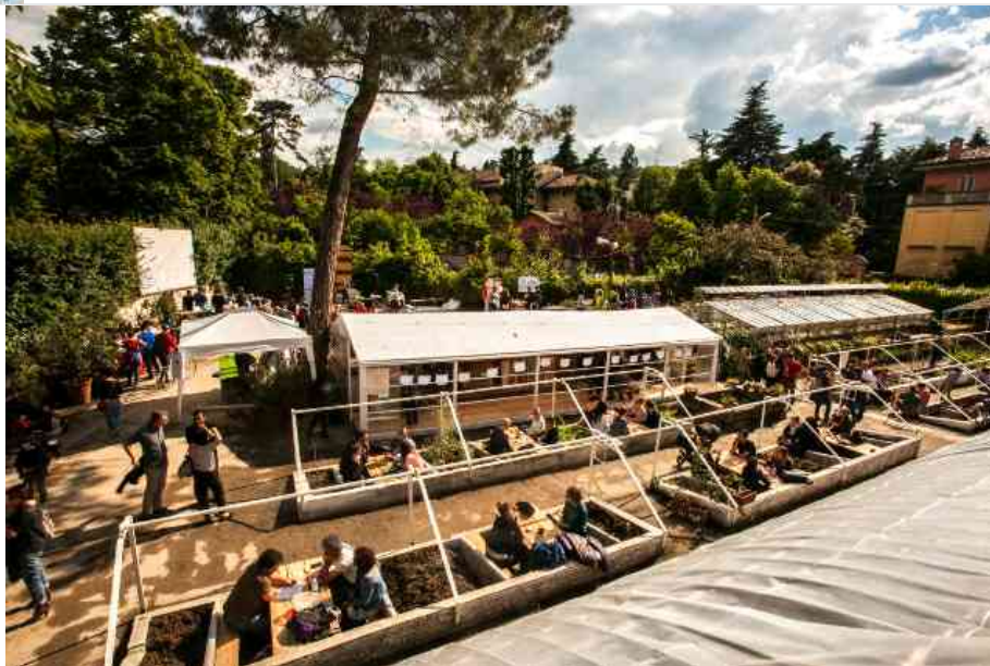
Le serre dei Giardini Margherita di Bologna