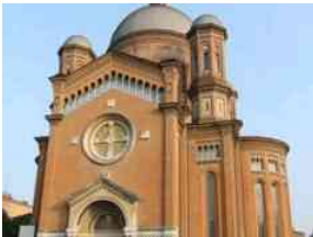
Terminati i lavori post sisma al Tempio Monumentale di Modena