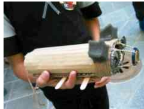
Scart si avvia alla chiusura con due giorni di laboratori creativi