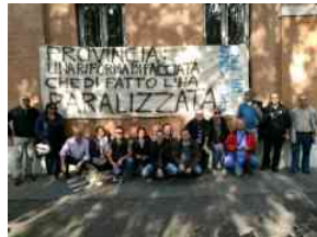
Oggi sciopero nazionale lavoratori Province e Città metropolitane