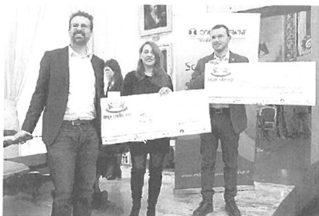
Terze a pari merito la Play Res e la cooperativa dei pediatri