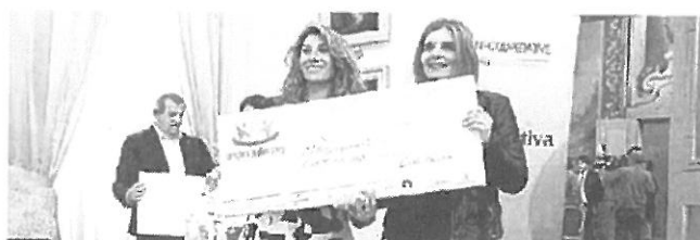
Secondo premio a Lab 4, una coop del settore caseario di Pavullo